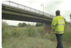
교량 및 화학플랜트