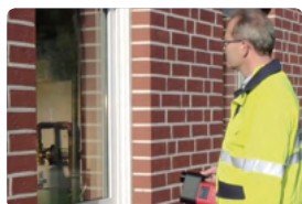
밀폐공간 밖에서의 검사