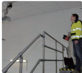
높은 위치의 누출검사