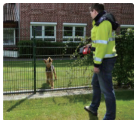
위험지역 회피 누출검사