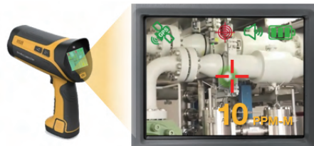
[LCD화면 디지털 뷰파인더]